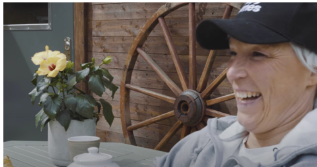
KAMPANJFILMER, Happy Homes Click to watch