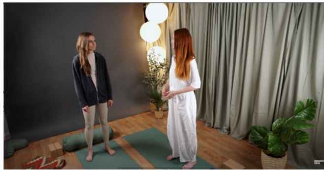
PRODUKTION AV KURSEN LEVA, Barncancerfonden https://www.barncancerfonden.se/maxa-livet/kursmaterial/