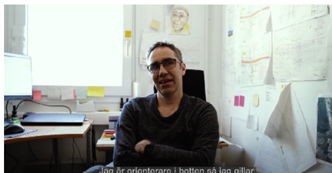
PR & EMPLOYER BRADNING, ZÜBLIN Click to watch